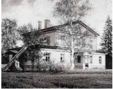
HAMINALAHTI, LINTUMAALAREIDEN KYLÄ.

Ferdinand von Wright oli nuorin ja tuotteliaim kolmesta taiteilijaveljeksestä. Veljiensä Magnuksen ja Wilhelmin tavoin hän maalasi pikkutarkalla biedermeier-tyylillä eläin- ja maisema-aiheita.