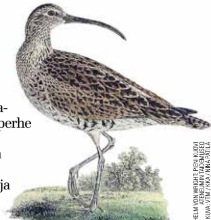
WILHELM VON WRIGHT, FERDINAND VON WRIGHTIN VELJE.

Ferdinand von Wright syntyi 19.3.1822 perheensä viidennenätoista lapsena. Haminalahden kartano, Kuopion lähellä, jossa suurperhe asui, oli varsin vaatimaton, keittiössään pelkkä maalattia. Koska toimeentulo saatiin lähinnä luonnosta, veljeksistä tuli taitavia metsästäjiä. Heissä yhdistyivät käden taidot ja silmän tarkkuus. Isän ampumat linnut olivat poikien piirustusten malleina.